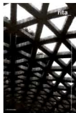
rita_ no. 1 Paraguay Redfundamentos, Madrid, 2013 136 páginas; 30 euros