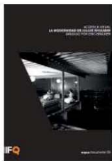
Eric Bricker (director) La modernidad de Julius Shulman F. Caja de Arquitectos, Barcelona, 2013 DVD 83'; 18 euros

DIVERGING FROM the procedure of past editions, the 12th Spanish Biennial of Architecture and Urban Planning has awarded 15 works grouped in 5 families: reconversion and reuse; territory and landscape; urban revitalization and transformation; participative and social action; and 'civic symbols'. The variety of designs echoes the plurality of generations and perspectives, which reflects the transformation the discipline is undergoing in Spain. Titled like the Biennial motto, Inflexión / Turning Point , the catalog of the exhibition presents the 15 winners and 27 finalists, besides a selection of final-year school projects, and can be downloaded in pdf form at www.fundacion.arquia.es