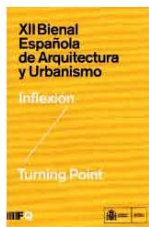
XII BEAU Inflexión / Turning Point F. Caja de Arquitectos, Barcelona, 2013 484 páginas; 35 euros