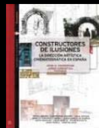
Filmoteca Valenciana, Ciudad de la Luz, 2010.