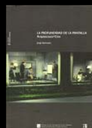
Colegio de Arquitectos de Canarias y