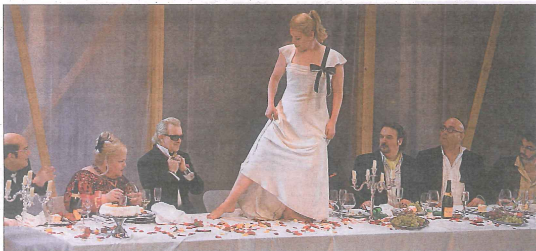
La soprano Nina Stemme, de pie sobre la mesa, en una escena del montaje de Salomé en el ensayo general del Liceo.