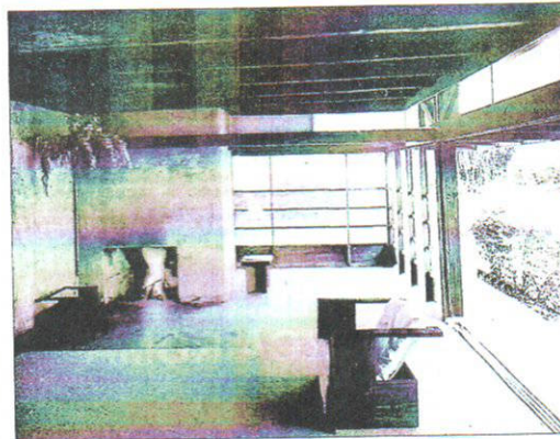
Casa en Kings Road. Interior del estudio del arquitecto R.M. Schindler.

viendas particulares hasta edificios para albergar a gente humilde. Como la casa que Richard J. Neutra construyó para el cineasta Josef von Stenberg, inspirada en un avión; las Case Study Houses,