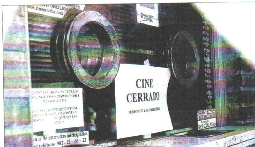
Imagen reciente (y metafórica) de una taquilla de un cine de Valencia.

Denuncia el trato de favor a las películas españolas frente a las de Estados Unidos que contempla la nueva Ley del Cine