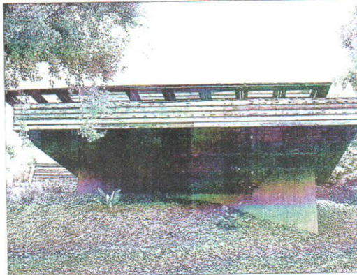
Casa Sturges, en Brentwood (Los Ángeles), obra de Frank Lloyd Wright (1939).

Los edificios seleccionados para la exposición leonesa son todo tipo de construcciones, desde vi-